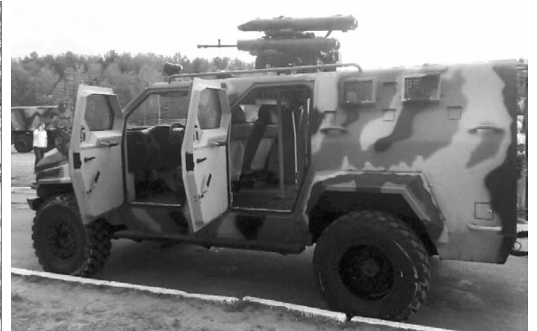
Бронеавтомобіль "КрАЗ – Спартан", із крупнокаліберним кулеметом і 4-ма ПТРК "Корсар" для боротьби з танками і БМП.